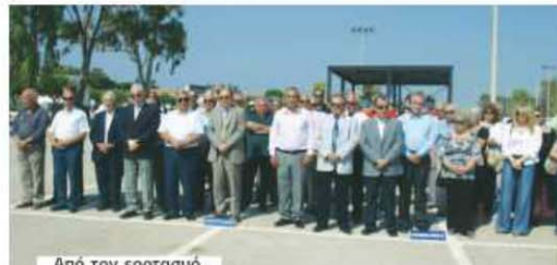
Από τον εορτασμό.

φανείας και αέρος». Η διαταγή περιείχε στοιχεία για τις παρεχόμενες υπηρεσίες του Π.Β.Κ. όπως «οι παρεχόμενες υπηρεσίες του Π.Β.Κ. συνεχώς βελτιώνονται και δεν περιορίζονται μόνο στην εκτέλεση και αξιολόγηση βολών αλλά επεκτείνονται σε εκτέλεση και όλα σχεδόν τα κράτη, πλέον των κρατών χρηστών και μελών του ΝΑΤΟ, αποτελώντας όργανο διπλωματίας αλλά και μέσο ανάπτυξης και σφυρηλάτησης διεθνούς εμπιστοσύ-