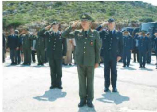
Στο κέντρο ο διοικητής του Π.Β.Κ. υποστράτηγος Λάζαρος Σκυλάκης.

Στην ημερήσια διαταγή του διοικητή του Π.Β.Κ. υποστράτηγου Λάζαρου Σκυλάκη, μεταξύ άλλων τονίζεται ότι «το Π.Β.Κ. συνεχίζει να συνεισφέρει στη τοπική οικονομία και να συμμετέχει ενεργά σε κοινωνικές και ανθρωπιστικές δραστηριότητες, έχοντας καταστεί αναπόσπαστο μέρος της κοινωνίας η οποία το έχει αγκαλιάσει και χωρίς την αποδοχή και συμπαράστασή της δεν θα μπορούσε να επιβιώσει». Για την ίδρυση του Π.Β.Κ. στη διαταγή αναφέρθηκε ότι «συμπληρώθηκαν 50 χρόνια από την υπογραφή της ιδρυτικής για το Π.Β.Κ. πολυμερούς συμφωνίας, με την οποία τις ημέρες εκείνες του ψυχρού πολέμου φίλια συμμαχικά έθνη ένωσαν τις προσπάθειές τους δημιουργώντας διεθνή εκπαιδευτική οντότητα υπό την ομπρέλα του ΝΑΤΟ. Τα χρόνια πέρασαν, το Π.Β.Κ. ανθώθηκε και χάρη στις κοινές προσπάθειες κρατών και συναδέλφων μας, καθιερώθηκε διεθνώς ως η κορυφαία εκπαιδευτική εγκατάσταση διεξαγωγής και αξιολόγησης ποικιλίας βολών, διαφόρων οπλικών συστημάτων ξηρά επι-