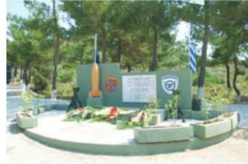
Μνημείο πεσόντων Ελλήνων αεροπόρων του Π.Β.Κ..