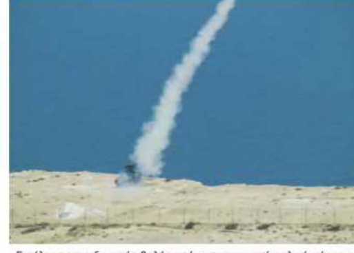
Εκτέλεση εκπαιδευτικής βολής από αντιεροπορικό οπλικό σύστημα ΟΖΕΛΟΤ.

νης και συνεργασίας[...]. Στις σημερινές δύσκολες παγκοσμίως οικονομικές συνθήκες και μέσα σε μια ασαφή και συνάμα στρατηγικής σημασίας περιοχή, το Π.Β.Κ. βασικό κυρίως στο ανθρώπινο δυναμικό του και τη συμπαράσταση των χωρών χρηστών και της τοπικής κοινωνίας, συνεχίζει τις προσπάθειές του, για την αντιμετώπιση των νέων προκλήσεων, την εκμετάλλευση των νέων τεχνολογιών και τη διατήρηση της ηγετικής του θέσης στο ανταγωνιστικό περιβάλλον των διεθνών αμυντικών εκπαιδευτικών εγκαταστάσεων».