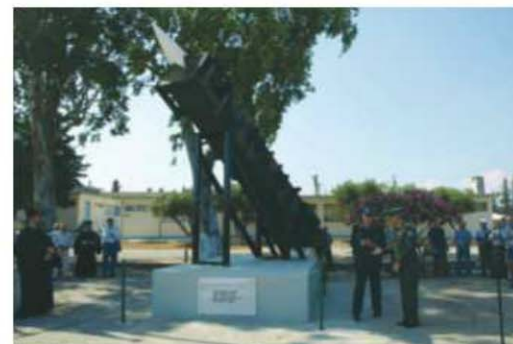
Αποκαλυπτήρια πυραύλου Patriot.